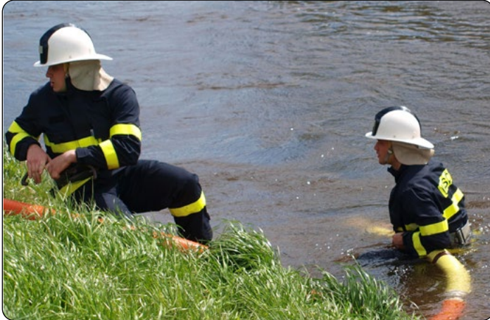
Sání z vody vyžaduje „objoživelné hasiče“

uloženo v zásahovém vozidle, tedy v Avii, nebo v zásahovém vozíku. Po startu členové družstva rozvinou útok na sklopné terče ve vzdálenosti 90 metrů, přičemž jsou oblečeni do zásahových obleků, včetně bot i přileb. Tématem této soutěže je příprava zásahových jednotek obcí. Proto je také tato soutěž brána jako námetové cvičení JSDHO. Bylo ve-