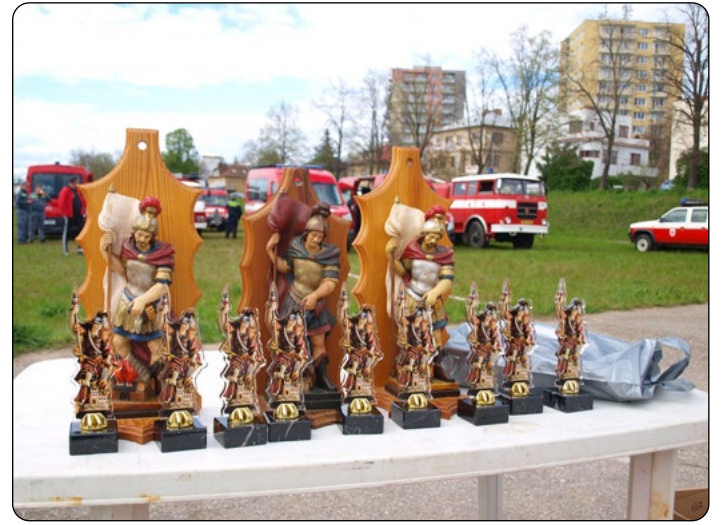
Ceny pro ty nejlepší

lice zajímavé a někdy i podnětné, pozorovat družstva s různým vybavením i věkovým složením, jak si dovedou poradit s nástrahami této tratě. Zejména členové mladších družstev nejdou se zájmem diskutovat se zkušenými hasiči o způsobu provádění jednotlivých