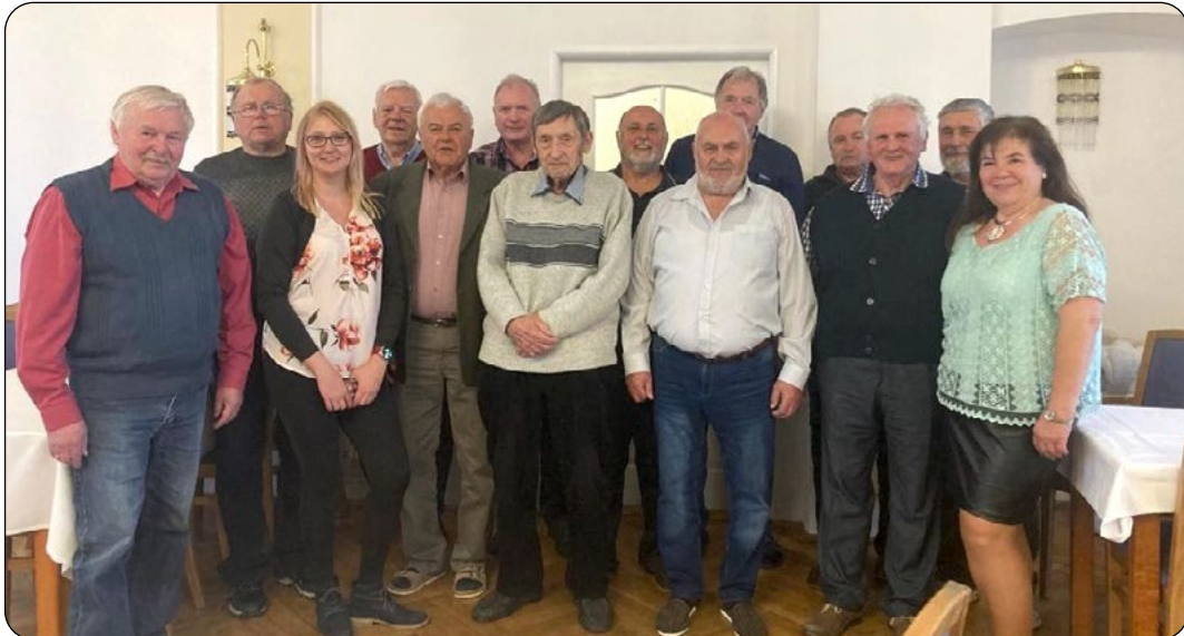
Společné foto účastníků