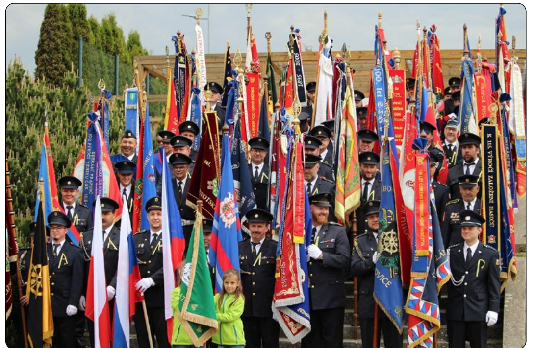
Pomyslný les hasičských praporů