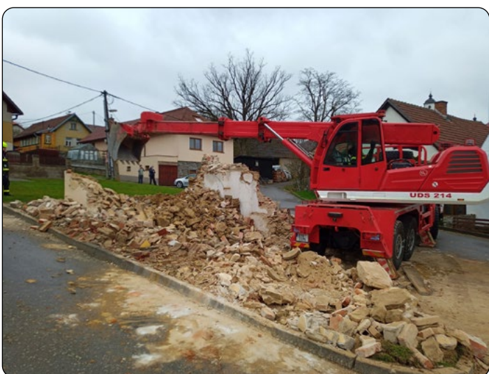
Příběh staré zbrojnice skončil. Ať se zdaří výstavba nové!