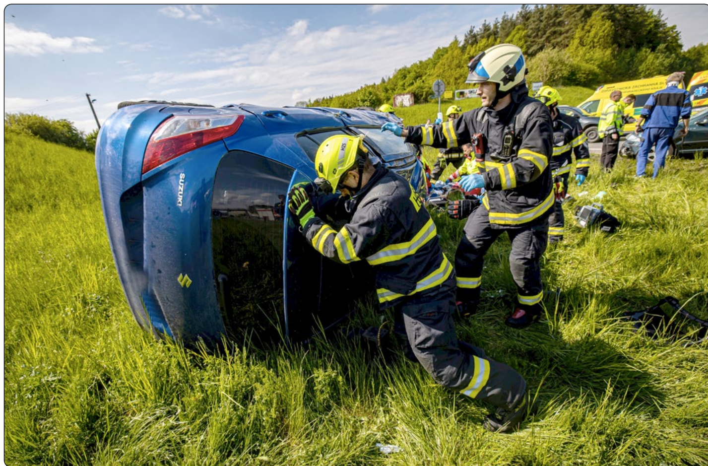
Za dveřmi jsou prázdniny a čas dovolených. Dávejte na sebe na silnicích pozor!