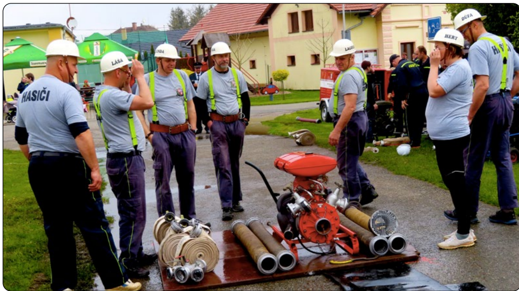
V SDH Chloumek nechybí soutěžní duch