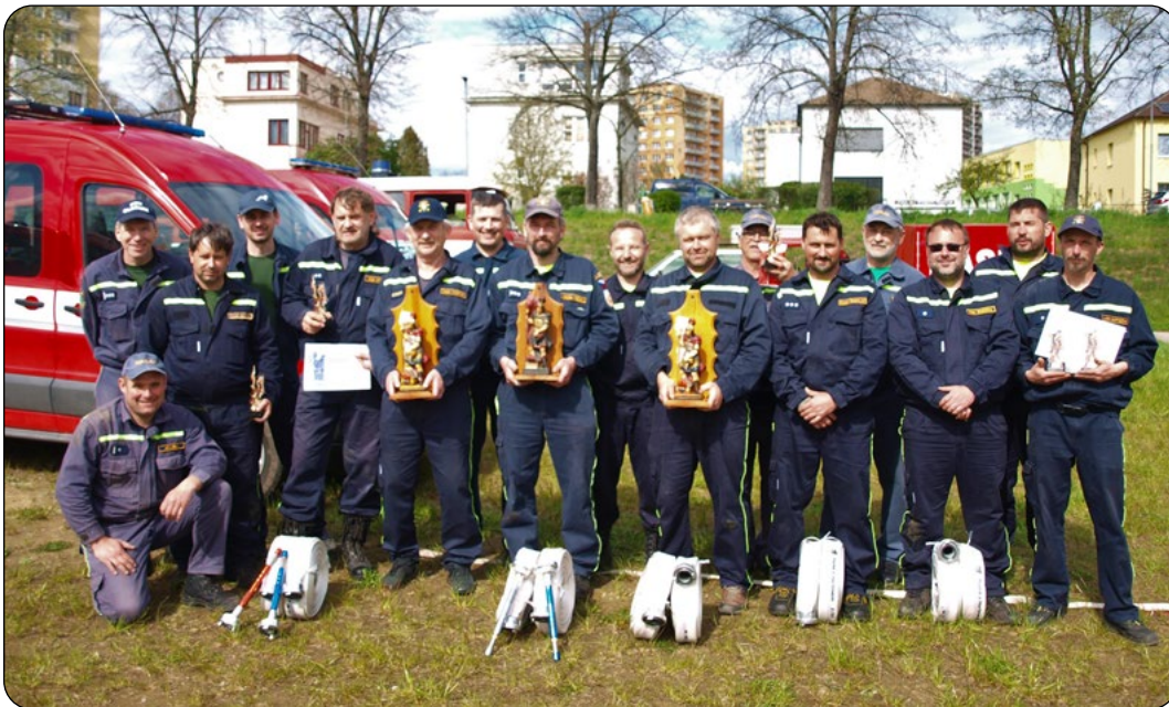
Soutěž proběhla již 33. ročníkem