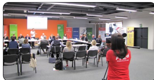
Zahájení ankety bylo možno sledovat na streamu