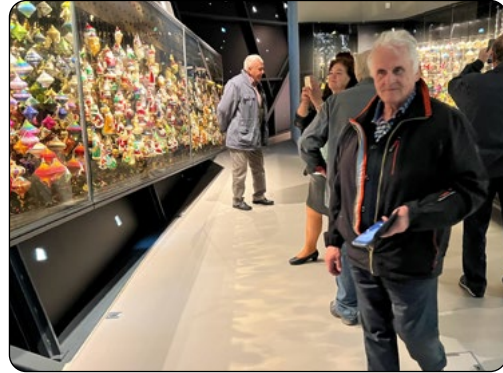
Prohlídka muzea skla a bižuterie