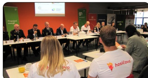
Zahájení ankety a tisková konference