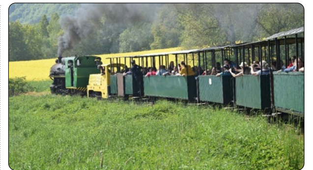
Jízda vlakem taženým parní lokomotivou