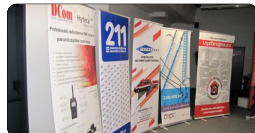
Bez sponzorů by to nešlo