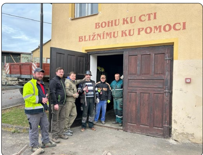
Snímek na památku před původní zbrojnicí