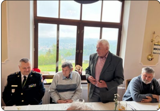
Setkání mělo pracovní i společenský charakter