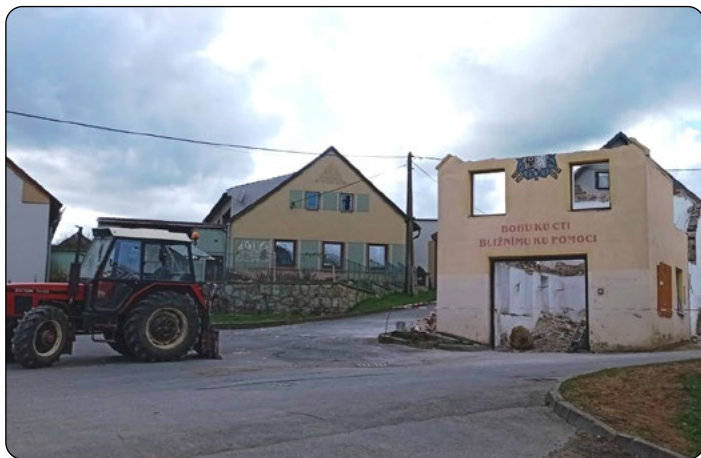
Stará zbrojnice dosloužila